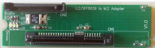
M2F U.2 (SFF8639) - M.2 (NGFF KeyM PCIe x4 )アダプタ