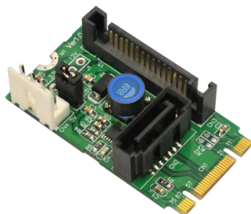
M2S (SATA 電源付 M.2-Socket2-B+M-2242SATA アダプタ) x1