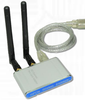
U.fl/IPX→RP-SMA メス変換 RF ケーブル