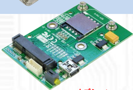
USBMA ver1.2 モジュール (筐体なし)

オプション: USBMA の IPX ケーブルを 4 本に変更可 (標準 2 本)