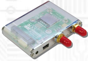
USBMA (無線通信 Mini Card 用 USB アダプタ v1.2) x1 IPX→RP-SMA メス変換 RF ケーブル: 2本内蔵