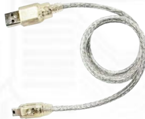
Y05-U04-060 (USB2.0 A オス- ミニ B5 ピンケーブル 60cm) x1