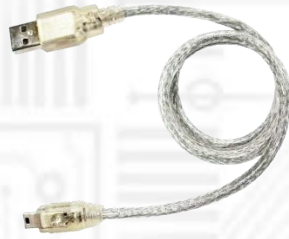
Y05-U04-060 (USB2.0 A オス- ミニ B5 ピンケーブル 60cm) x1