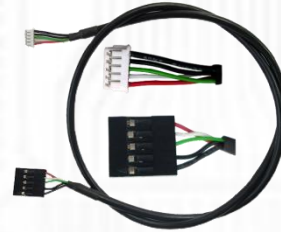
Y05-U02-060 (フロントパネル用 USB 5PIN ケーブル) x1