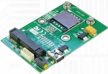
USBMA モジュール (無線通信 Mini Card 用 USB アダプタ v1.2) x1 * モジュールのみ。筐体はなし。